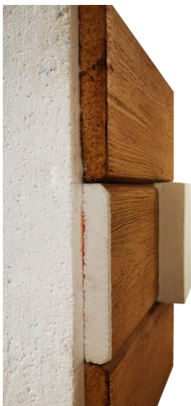
Rysunek poglądowy pokazujący montaż poszczególnych bali na narożnikach

Powłoki Tiserec z warstwą lakierobejcy LS2020 nie wymagają okresowej konserwacji. Na ścianach silnie nasłonecznionych przy zastosowaniu ciemnych kolorów może być wymagane ponowne przemalowanie powłok LS2020 po kilku sezonach. W takim przypadku zniszczoną lub zmatowiałą warstwę należy mechanicznie delikatnie usunąć i w miejsce nałożyć ponownie dwie warstwy bejcy. Pamiętając, że usuwamy wtedy warstwy z całego bala (nawet jeśli uszkodzeniu uległ fragment). Zabrudzenia usuwamy zwykłą wodą z dodatkiem delikatnych domowych środków czyszczących bez dodatków ekstraktów benzyn czy chlorków.