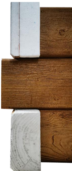
Budowa narożnika z Bali Tiserec